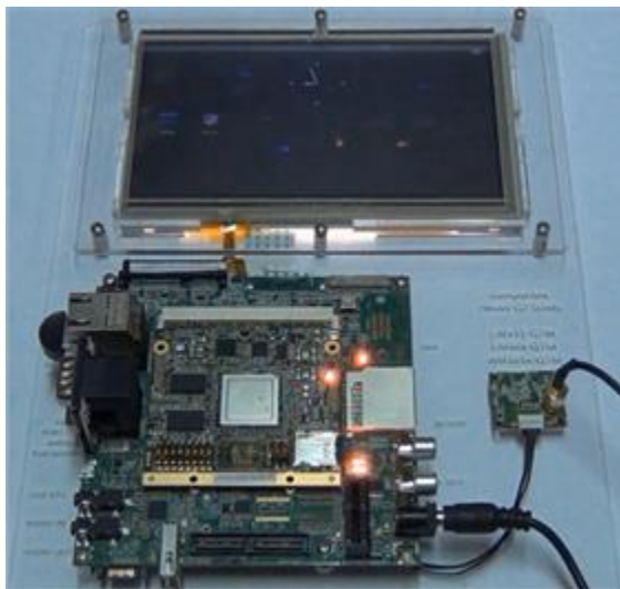
i.MX6Q G15D Development kit